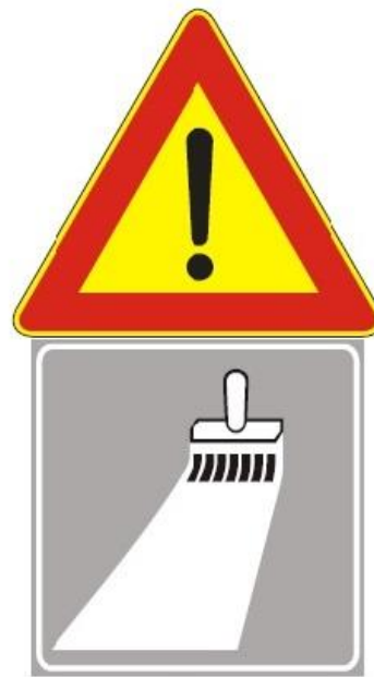
Figura Il 391 Art. 31