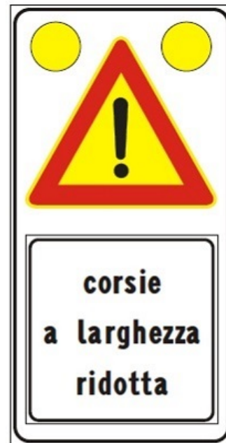
Figura II 391c Art. 31