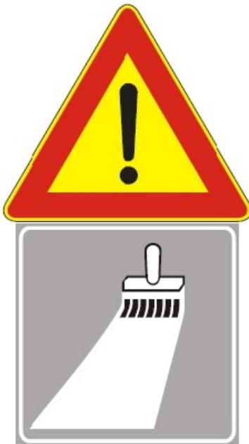
Figura II 391 Art. 31