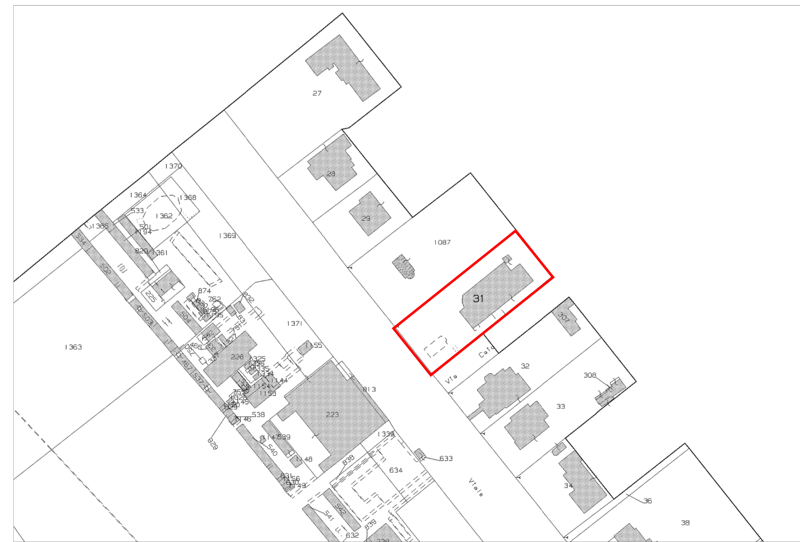
ESTRATTO MAPPA CATASTALE - SCALA 1:1000