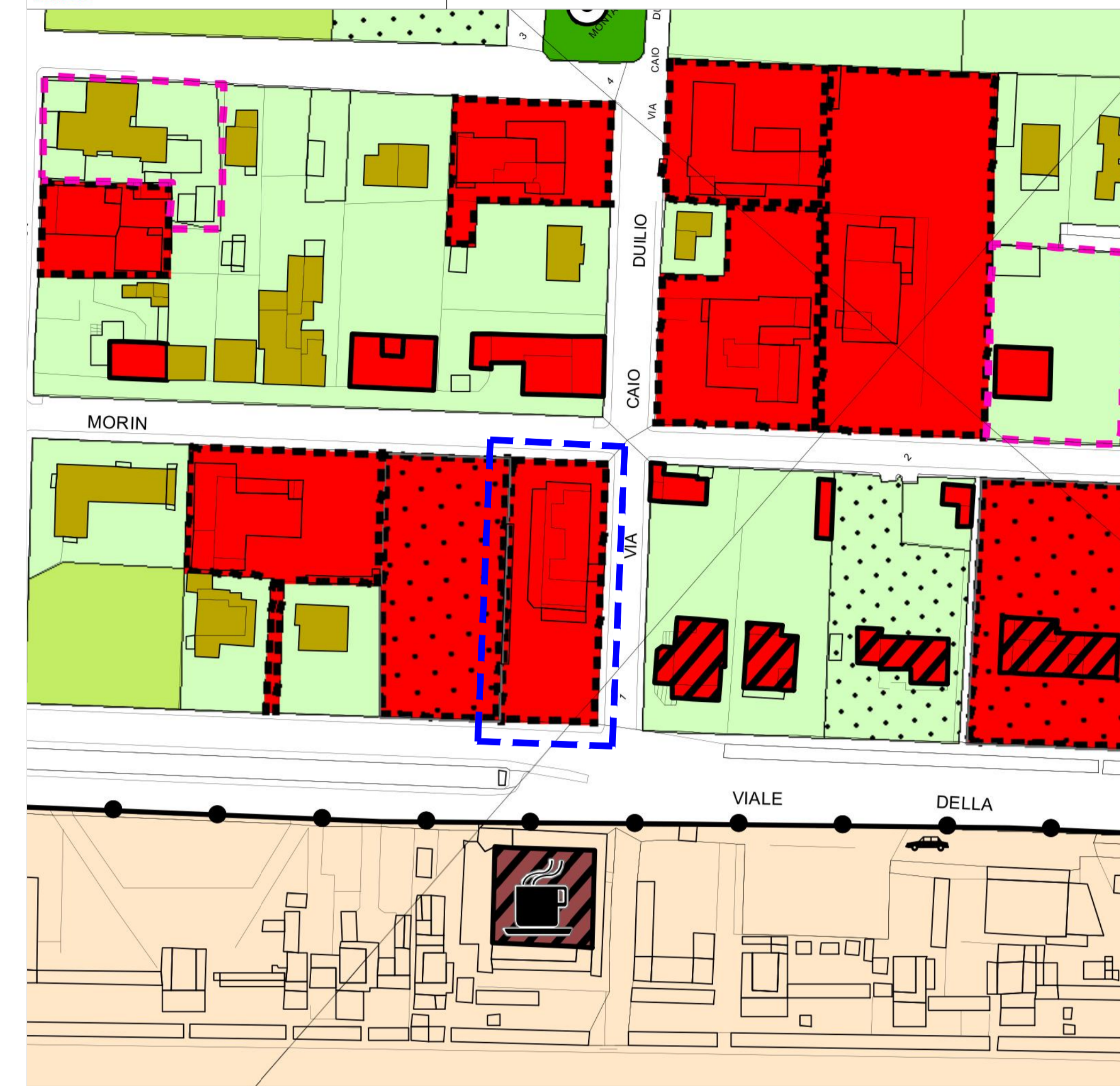
ESTRATTO REGOLAMENTO URBANISTICO