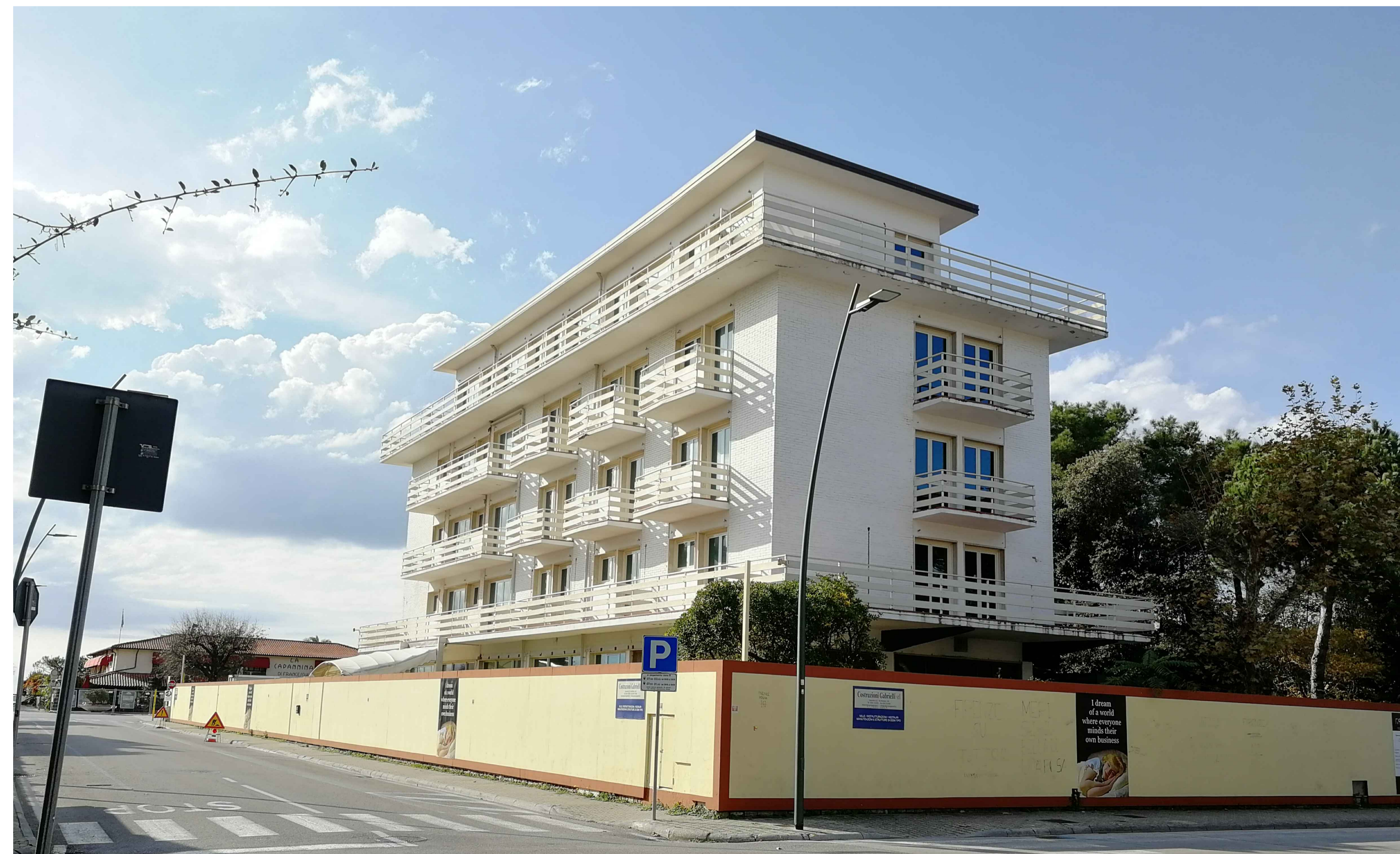
VISTA 4 - STATO ATTUALE - ANGOLO VIA CAIO DUILIO - VIALE MORIN