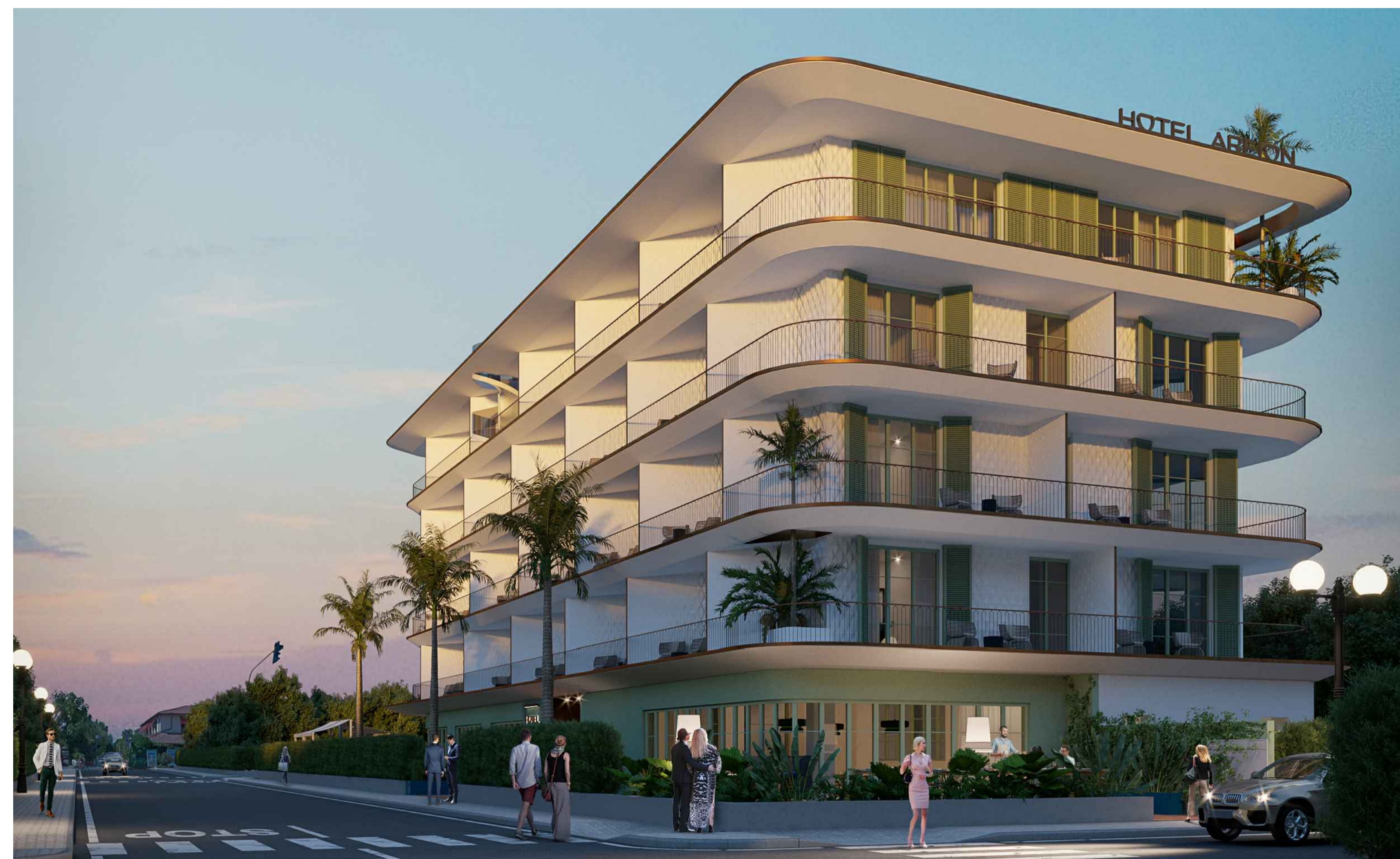
VISTA 4 - IPOTESI DI PROGETTO - ANGOLO VIA CAIO DUILIO - VIALE MORIN

A - Data: NOVEMBRE 2022 B - Scala: C - Progetto: 21F10 Spazio riservato all'ufficio