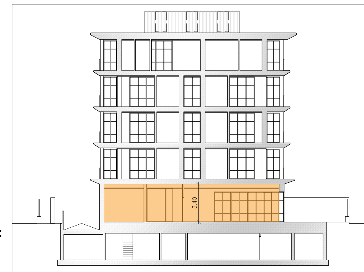
SEZIONE B-B' - SCALA 1:200