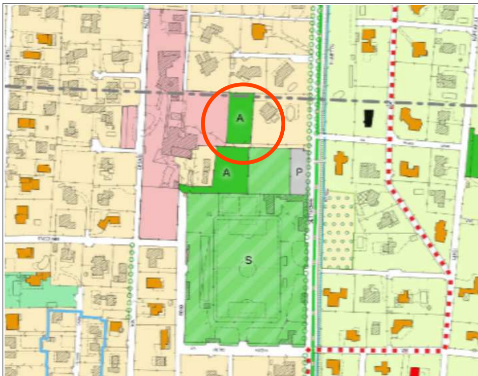
VERDE ATTREZZATO (art.39)

(adottato con Delibera del Consiglio Comunale n.14 del 22/04/2022)