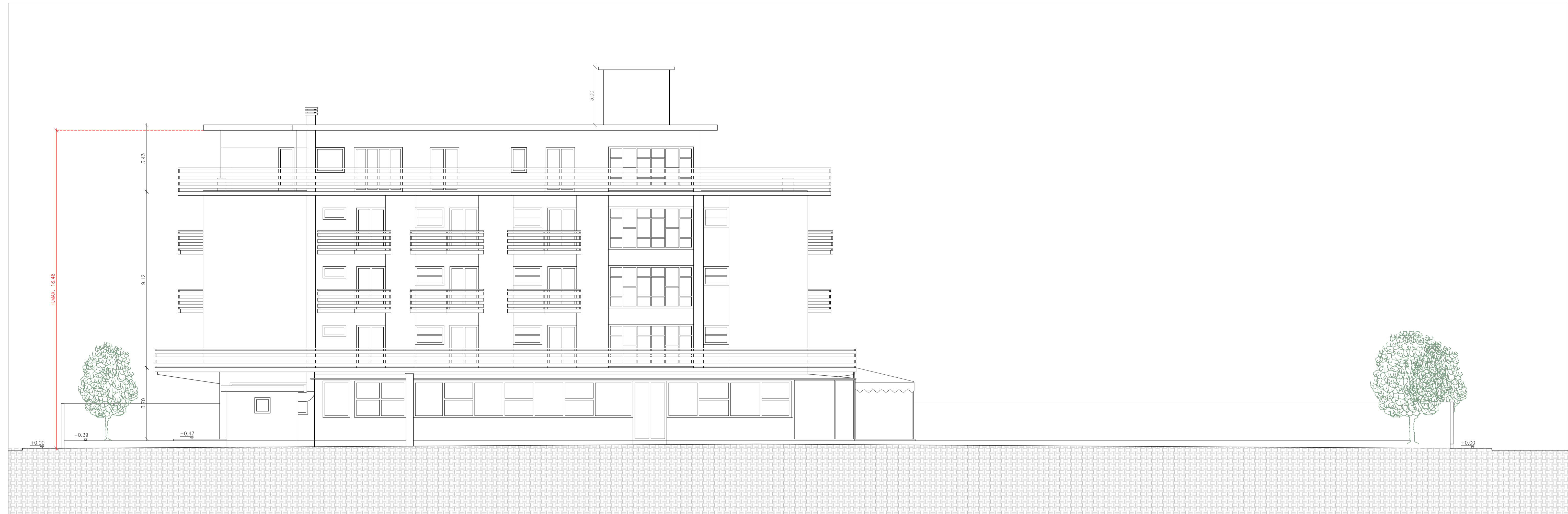
PROSPETTO 1 - NORD-OVEST - SCALA 1:100