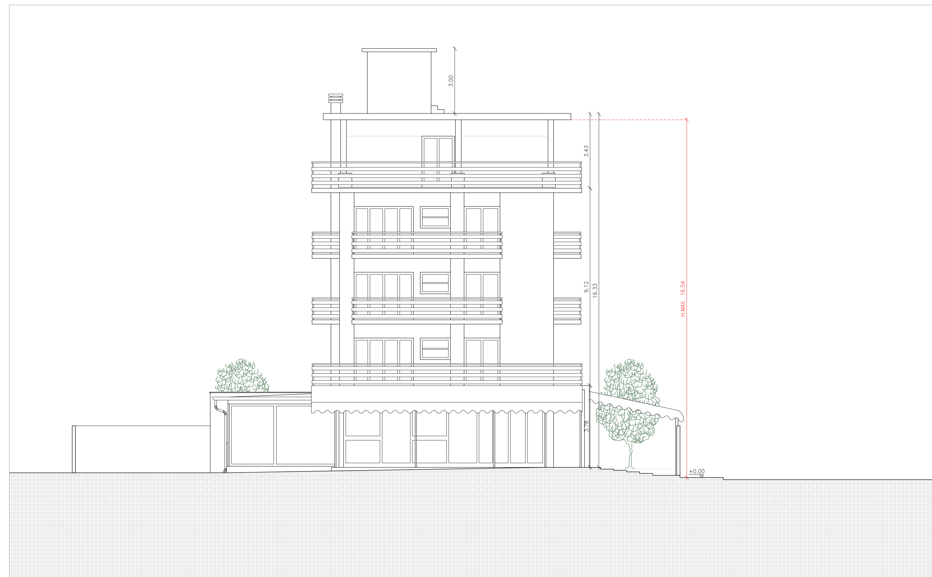
PROSPETTO 2 - LATO MARE - SCALA 1:100

H.MAX.: da marciapiede (+0.00m) a inistradoso struttura ultimo piano