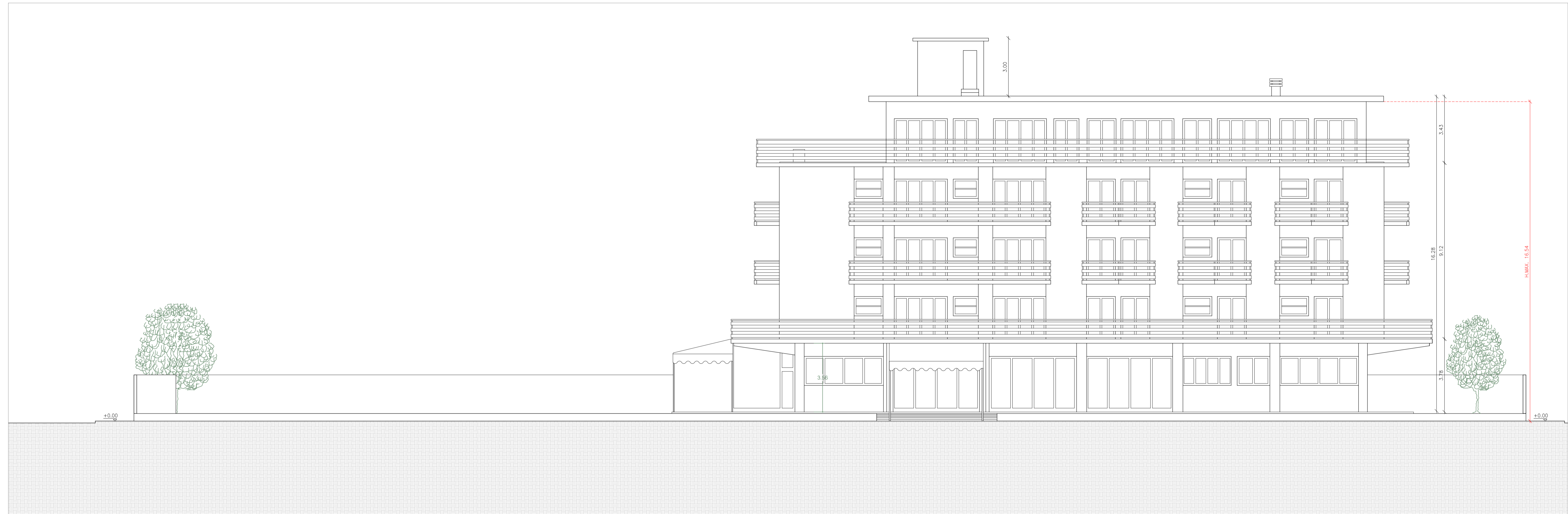
PROSPETTO 3 - SUD-EST - SCALA 1:100

A - _____ Data: NOVEMBRE 2022 B - _____ Scala: SCALA 1:100 C - _____ Progetto: 21F10 Spazio riservato all'ufficio