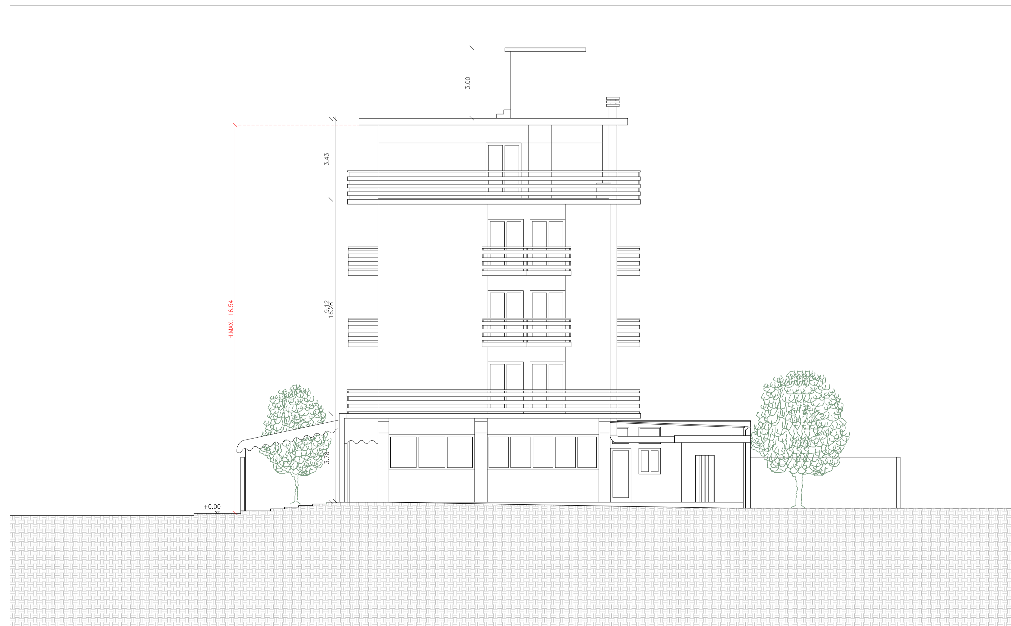
PROSPETTO 4 - LATO APUANE - SCALA 1:100

H.MAX.: da marciapiede (+0.00m) a inistradosso struttura ultimo piano