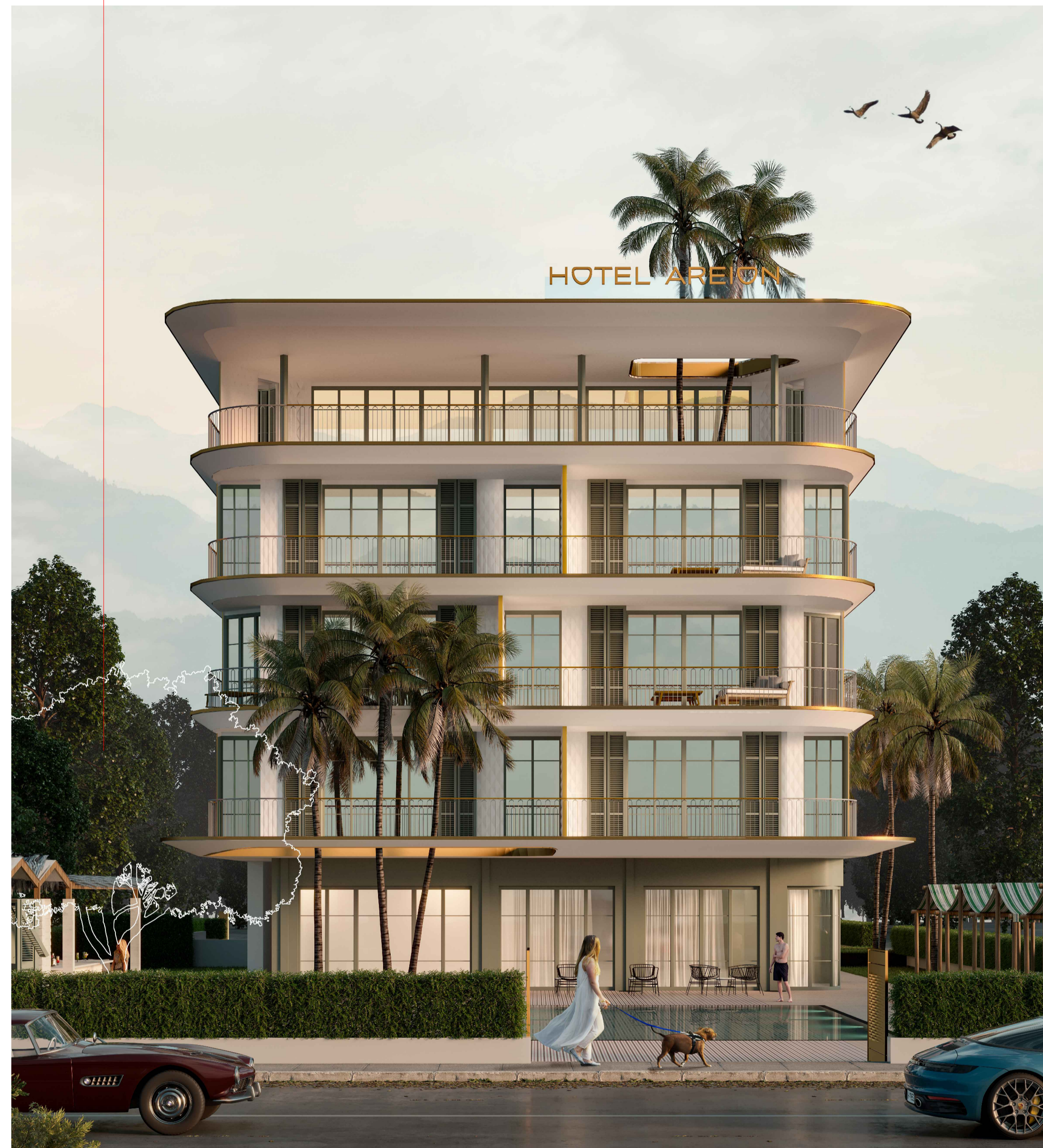
VISTA 1 - STATO DI PROGETTO - VISTA VIALE DELLA REPUBBLICA

NON SONO STATI RAPPRESENTATI I LECCI COME DA PROGETTO PER MEGLIO VISUALIZZARE IL PROSPETTO DELL'EDIFICIO