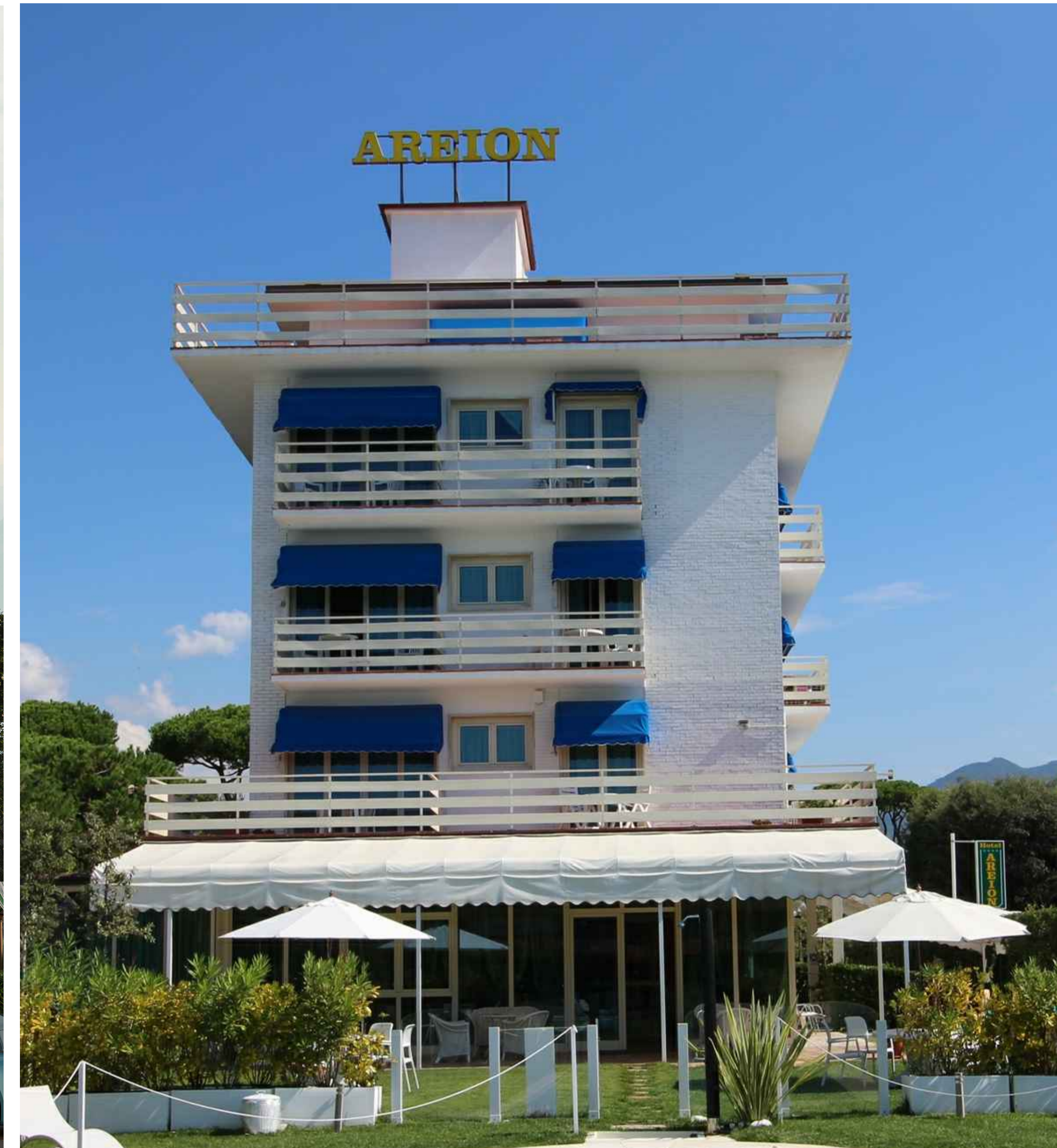
VISTA 1 - STATO DI FATTO