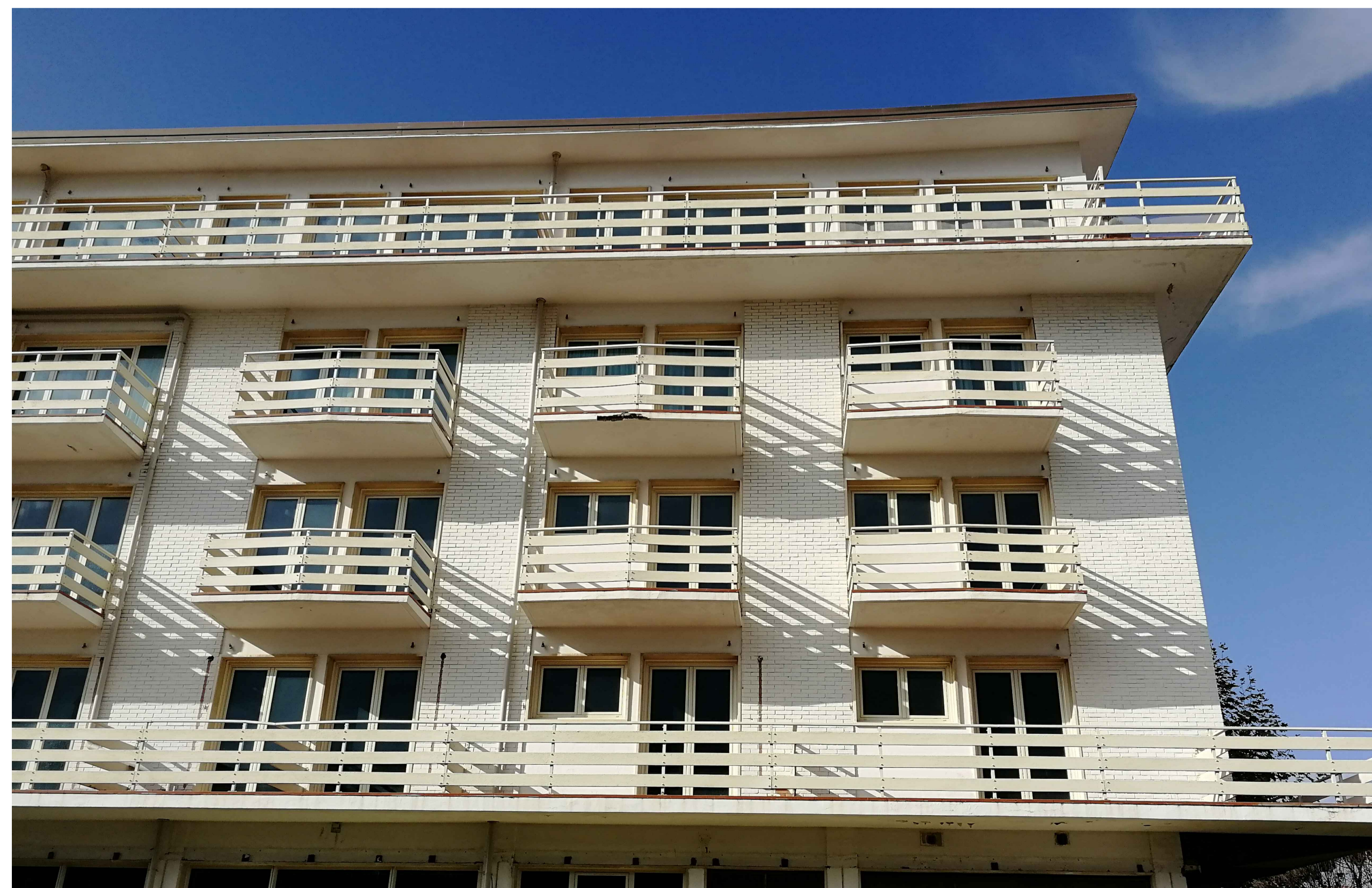
VISTA 2 - STATO DI FATTO