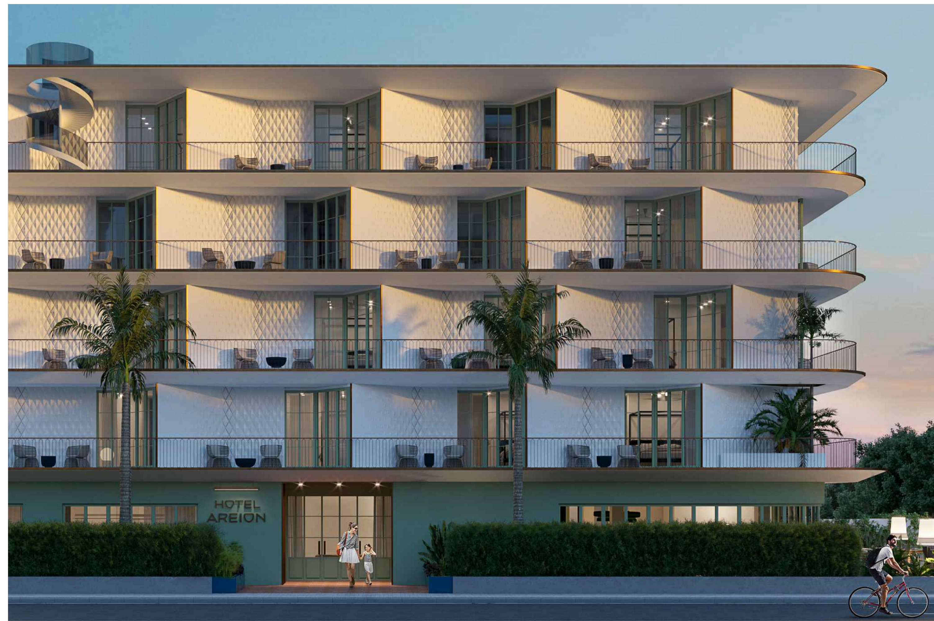
VISTA 2 - IPOTESI DI PROGETTO - VISTA DA VIA CAIO DUILIO

A - Data: NOVEMBRE 2022 B - Scala: C - Progetto: 21F10 Spazio riservato all'ufficio