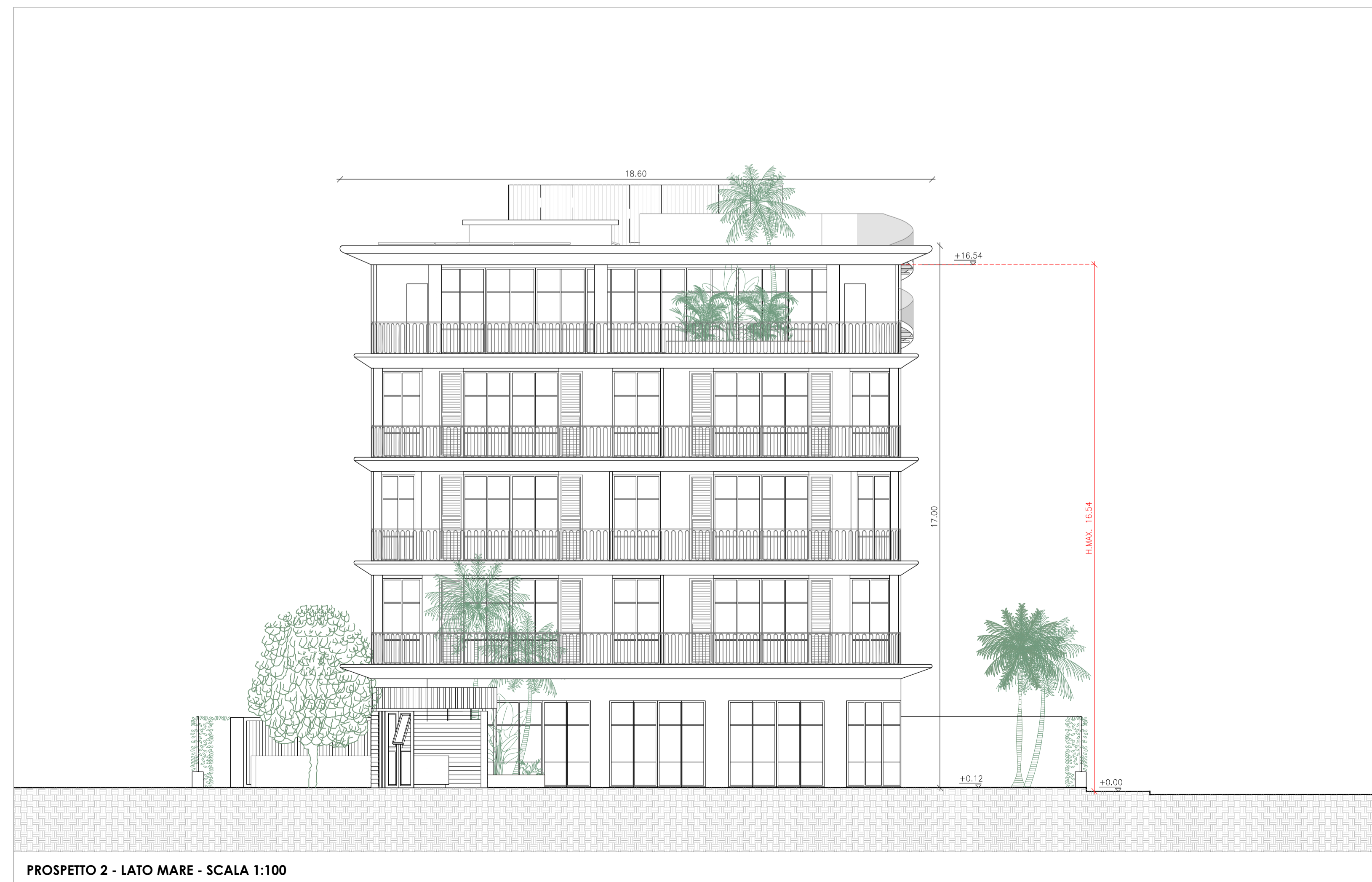
PROSPETTO 2 - LATO MARE - SCALA 1:100

H.MAX.: da marciapiede (+0.00m) a inistradso struttura ultimo piano