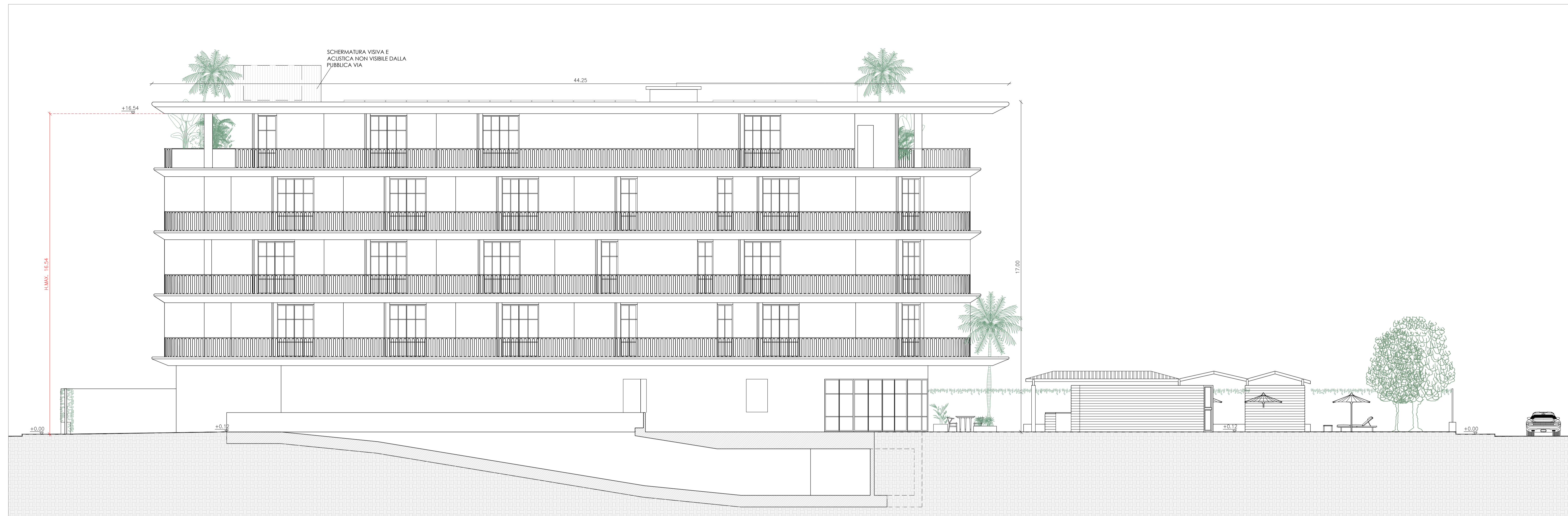
PROSPETTO 1 - NORD-OVEST - SCALA 1:100