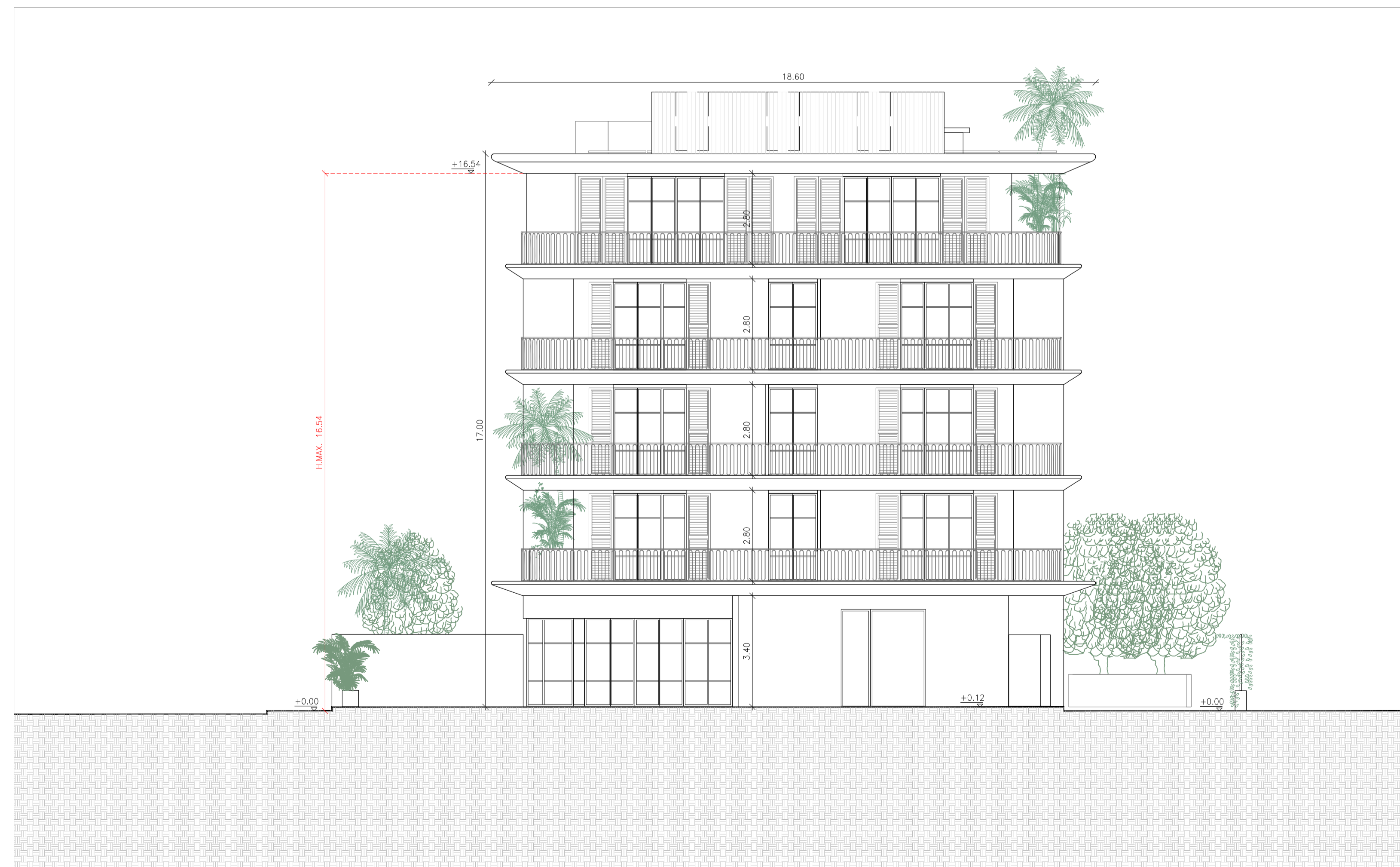
PROSPETTO 4 - LATO APUANE - SCALA 1:100

H.MAX.: da marciapiede (+0.00m) a inistradosso struttura ultimo piano