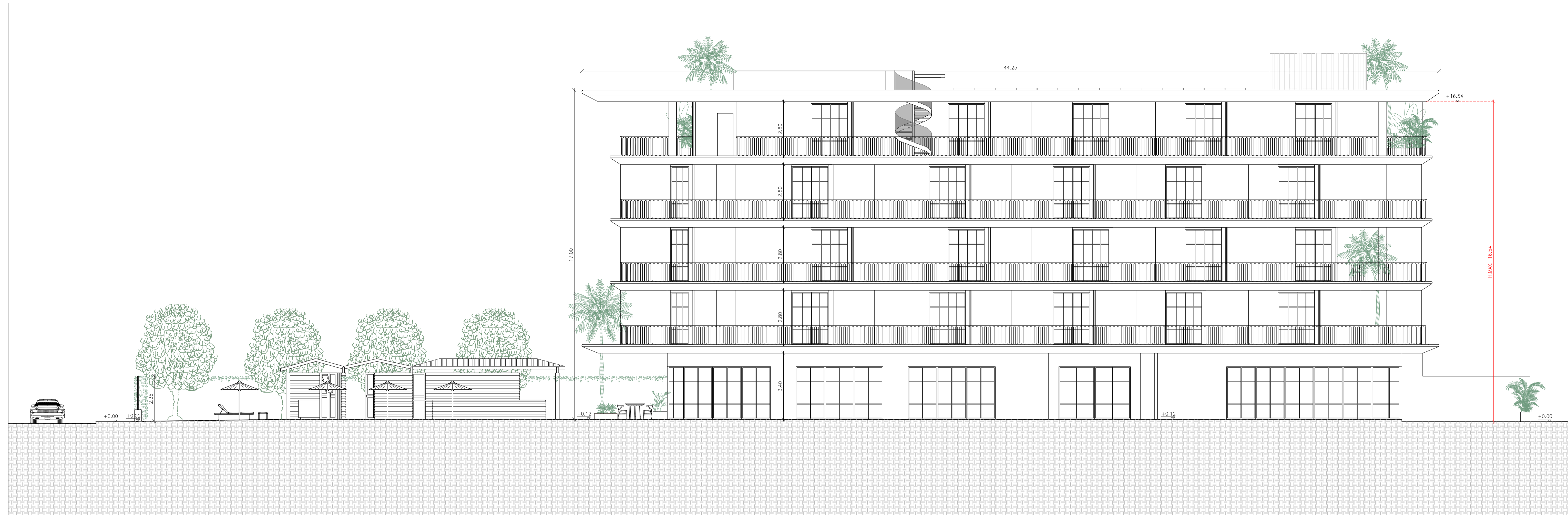
PROSPETTO 3 - SUD-EST - SCALA 1:100