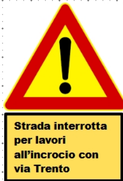
Fig. II: via Michelangelo incrocio via Matteotti (da mare a monti)